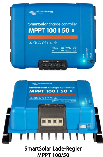
SmartSolar Lade-Regler MPPT 100/50

Apple und Android Smartphones, Tablets und weitere Geräte. -Color Control GX und andere GX-Produkte.